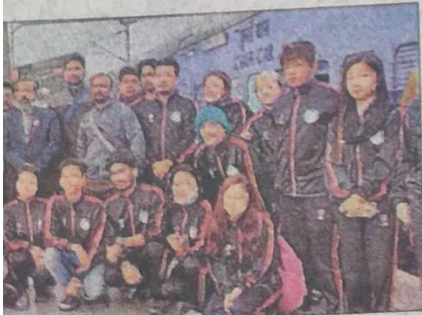
ल अरुणाचल की टीम शनिवार को रवाना हो गई।