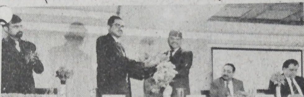
One Week National Workshop

मिर्जापुराद / वाराणसी (एसएनबी)। काशी इंस्टीट्यूट ऑफ टेक्नोलॉजी मिर्जापुराद के प्रांगण में सोमवार को रिसर्च मेथाडोलॉजी एंड क्वान्टेटिव डाटा एनालिसिस यूजिंग एसपीएसएस एंड एएमओएस कार्यशाला का उद्घाटन किया गया।