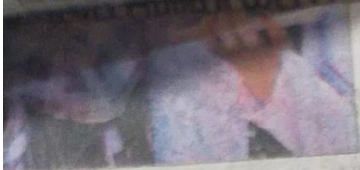
इस तरह एक-दूसरे से मिलें। रंग